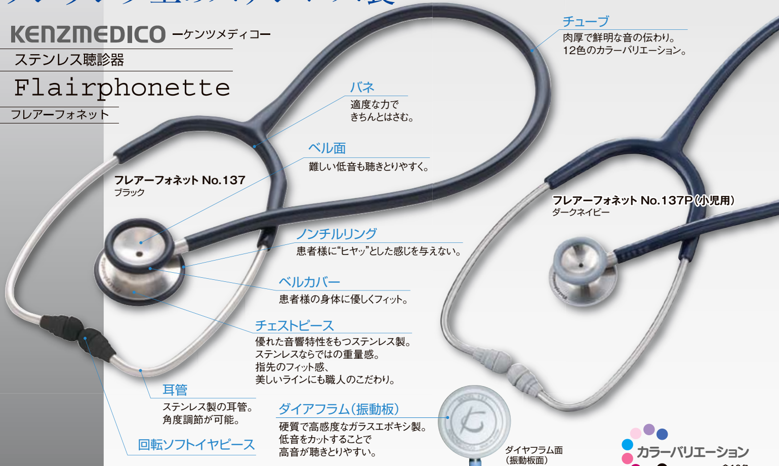
フレアーフォネット No.137 ブラック