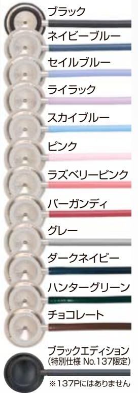
ブラックエディション (特別仕様 No.137限定) ※137Pにはありません