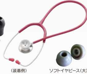
(装着例) ソフトイヤピース(大)